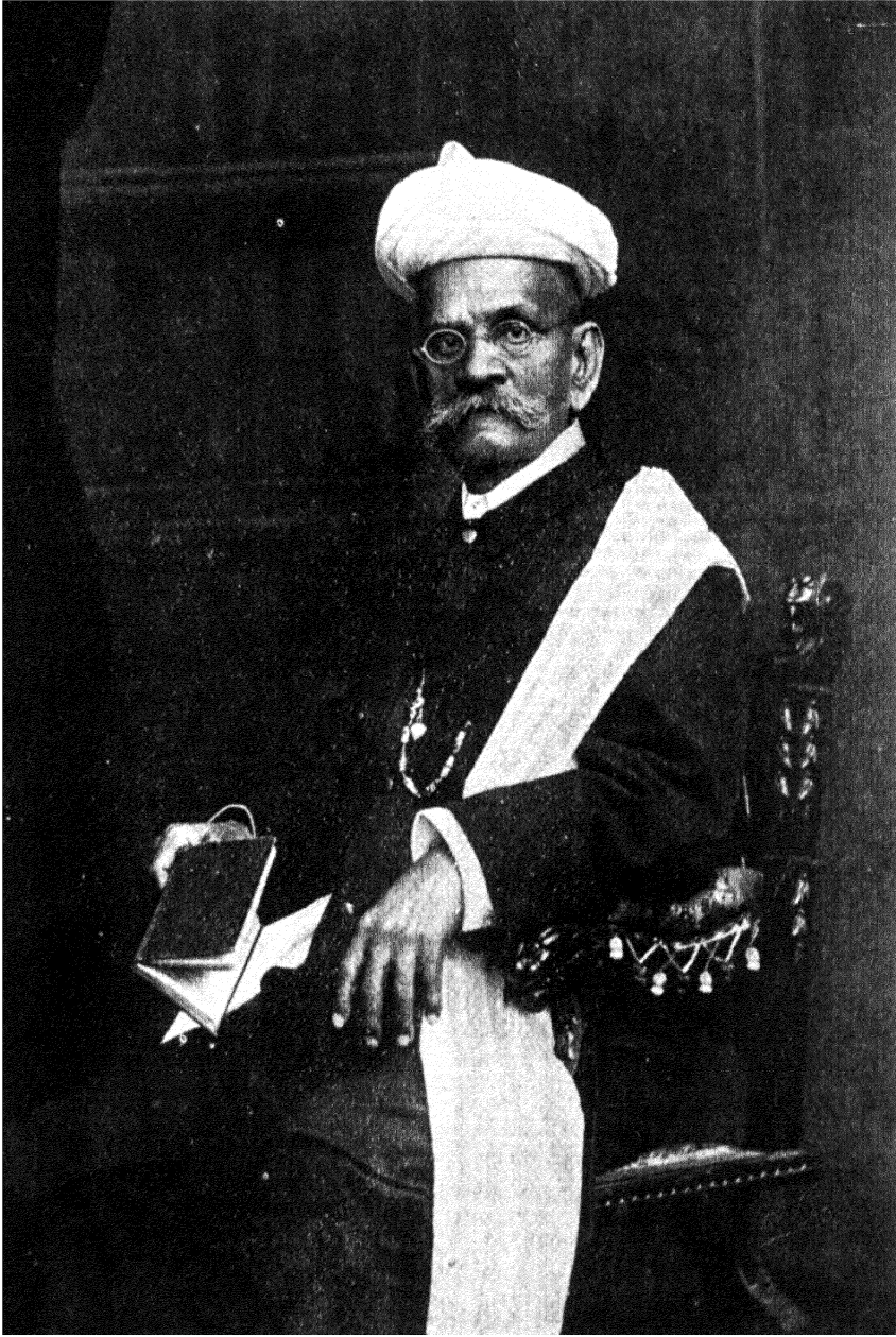
रामकृष्ण गोपाळ भांडारकर